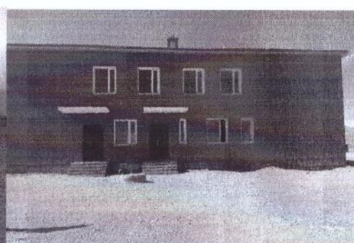
Бигэр сумын хүүхдийн цэцэрлэг

Зөрчигдсөн хуулийн заалт: 2015 оны 6 дугаар сарын 22-ний өдрийн Аймгийн Засаг даргын баталсан “Барилга их засварын ажлын гүйцэтгэгч, захиалагч хяналт гүйцэтгэгчийн хооронд байгуулсан 3-ласан гэрээ дугаар А220/10/15 Захиалагчийн эрх үүрэг үйл ажиллагаа” 2.1.1 /Зураг төсөл, техникийн даалгавараас зөрүүтэй боловсруулсан зураг төсөл, ажил болон техникийн хүчин чадал, технологийн шаардлагыг хангаагүй бүрэн бус тоног төхөөрөмж машин механизм, материалыг хүлээн авахыг татгалзах/-ыг зөрчсөн байна.