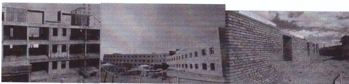
Баян-Уул сургуулийн гүйцэтгэл Төрөх эмнэлэг 50 ортой Тайшир сумын цэцэрлэг