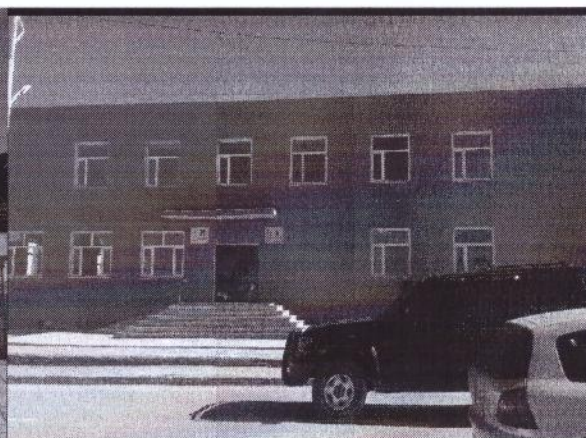
“АЗД авто гражын барилга