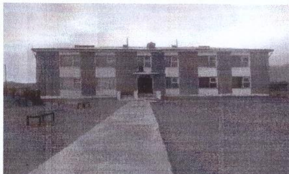
Тонхил сумын Хүүхдийн цэцэрлэг

өгсөн, хана дахин засварлах, цэвэр бохир усны шугам солих ажлуудыг хийгээгүй байхад улсын комисс хүлээн авсан нь хариуцсан ажилдаа хариуцлагагүй хандсан үйлдэл болсон байна.