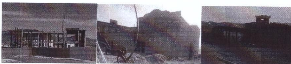
Тайшир сумын Соёлын төв Хүүхдийн ордон Аврах гал унтраах анги

Төсвийн тухай хуулиар батлагдсан боловч аймагт огт хийгдээгүй 2 ажил байна.