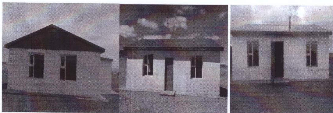
Жаргалан сум бүрэн багийн төвийн байр

Аймгийн ИТХ-ын 2014 оны 07 сарын 22 өдрийн 67 дугаар тогтоолоор 3 багийн төвийн байр барих нийт 80.0 сая төгрөгийн төсөв батлагдаж харьцуулалтын аргаар тендер шалгаруулалт зарлагдаж “Орд харш” ХХК-тай шалгарсан байна.